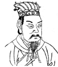
Fig. Portrait of Cao Cao for king of old Chinese (中国三国時代の魏王「曹操」)

Which column (1st Cao or 2nd Cao) is the answer?